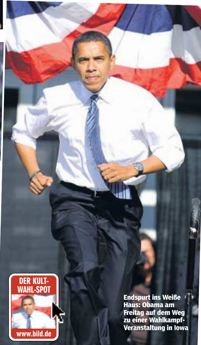
Endspurt ins Weiße Haus: Obama am Freitag auf dem Weg zu einer Wahlkampf-Veranstaltung in Iowa