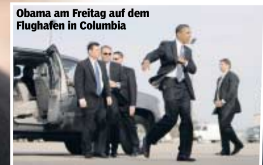
Obama am Freitag auf dem Flughafen in Columbia

Gut aussehend, erfolgreich, visionär – und bald Präsident? Viele Amerikaner sehen in Barack Obama schon jetzt den „schwarzen Kennedy“