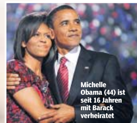
Michelle Obama (44) ist seit 16 Jahren mit Barack verheiratet